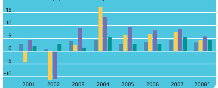
גידול בתמ"ג בגוש המרקוסור לפי מדינה (%)